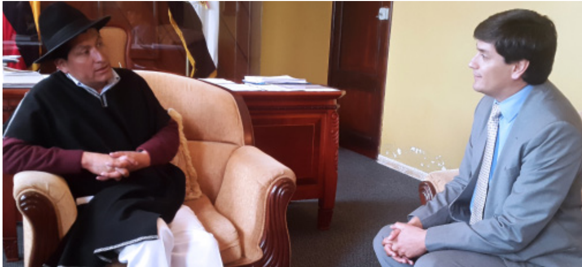
Trabajo interinstitucional en el cantón San Pedro de Pelileo a fin de mejorar la calidad de los servicios públicos domiciliarios.