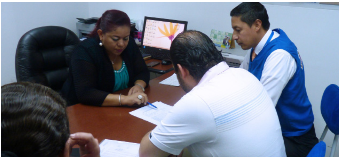
Admisión de petición de usuarios/as en las oficinas de la Coordinación Zonal N° 3.