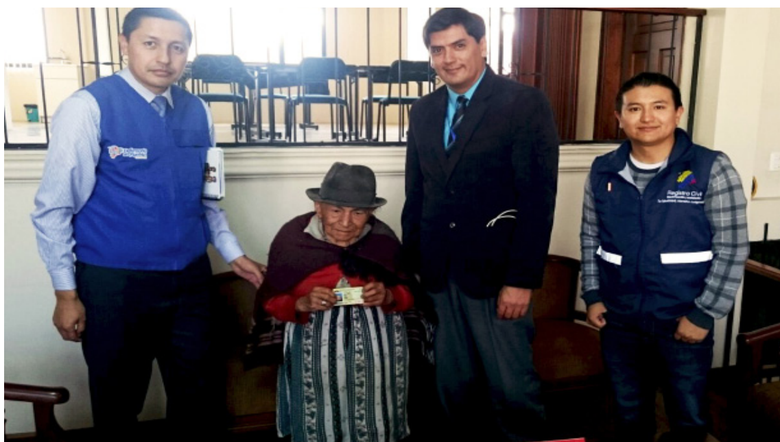
La Coordinación Zonal N° 3 realizó una gestión oficiosa a favor de adulta mayor.

Mediante gestión oficiosa en coordinación con el Registro Civil, se tuteló el derecho a la identidad personal garantizada en la Constitución de la República del Ecuador de Laura (nombre protegido) una persona adulta mayor de escasos recursos económicos que no poseía cédula de ciudadanía.