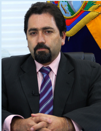
Defensor del Pueblo Ecuador