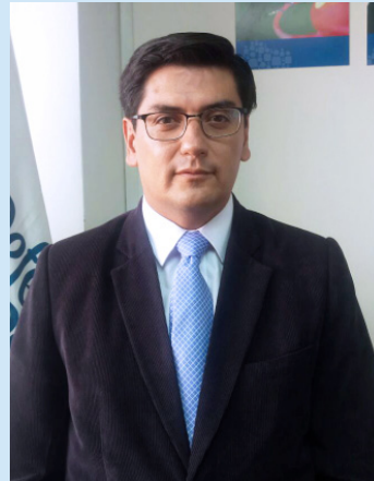
Coordinador General Defensorial Zonal N°3