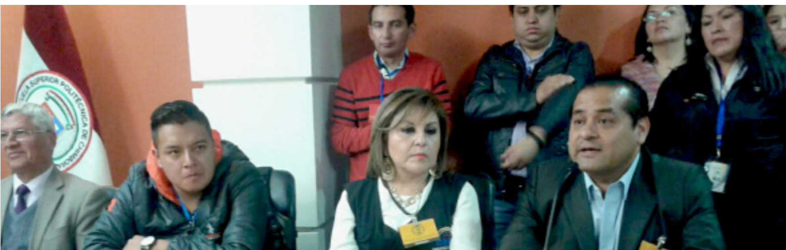
Seguimiento de cumplimiento de sentencias constitucionales de dos acciones de protección interpuestas al proceso de elección de autoridades en la Escuela Superior Politécnica de Chimborazo.