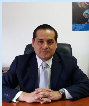
Delegado Provincial de Chimborazo