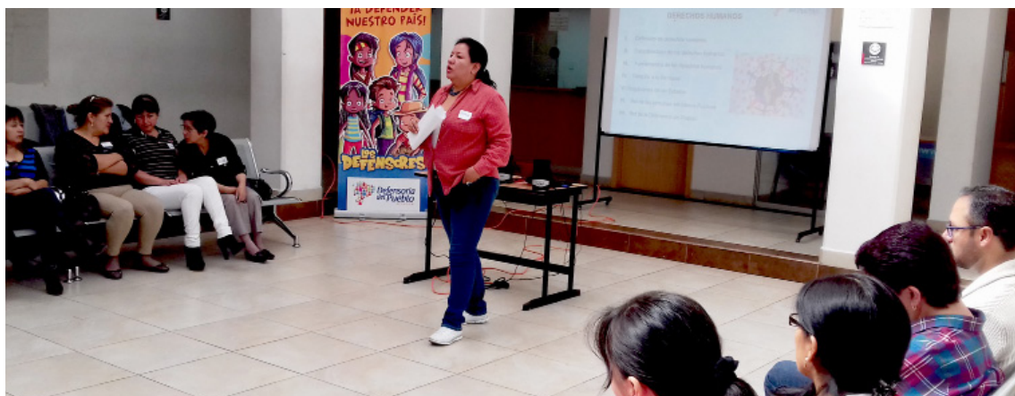
Delegación Provincial realizó capacitación en derechos humanos a sociedad civil y servidoras/es públicos.