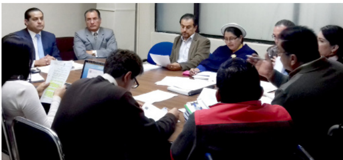
Delegado Provincial participa en la construcción y presentación del Proyecto de Ordenanza Derechos de Personas Adultas Mayores