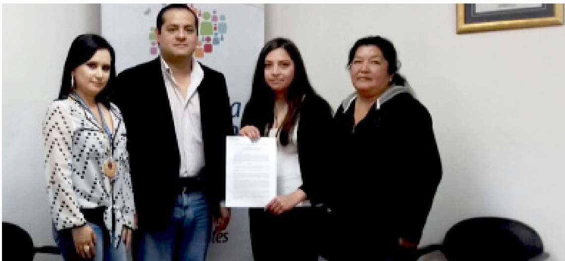
Estudiantes que por varios años venían cursando en una unidad educativa, no se les quiso renovar la matrícula, aduciendo que en el año lectivo pasado 2015-2016 habían registrado antecedentes de atrasos de pago de sus pensiones.

En una unidad educativa se negó renovar la matrícula a estudiantes, aduciendo que en el año lectivo 2015-2016, registraban antecedentes de atrasos en el pago de pensiones. Se tuteló el derecho a la igualdad y no discriminación de las estudiantes y se garantizó que continúen sus estudios en la misma unidad educativa.