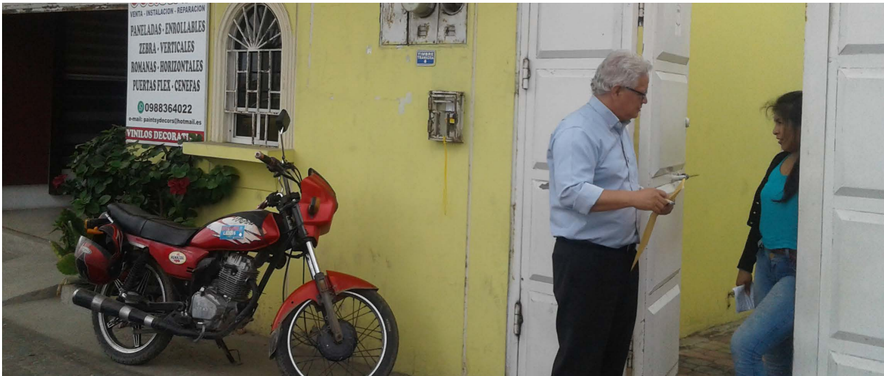
Diálogo con funcionaria de empresa de transporte para precautelar derecho de una persona con discapacidad.

Con el objetivo de garantizar los derechos de las personas con discapacidad, la Defensoría del Pueblo inició una investigación defensorial, después de la cual exhortó a los dirigentes de la cooperativa TRUNSA S.A., a que este tipo de acciones no se repitieran; y a que exista, por parte del personal, un trato adecuado y preferente hacia las personas con discapacidad.