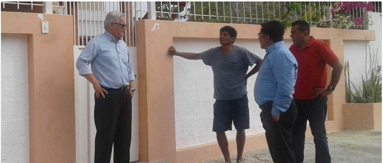
Servidores de la Delegación Provincial de Santa Elena dialogan con uno de los moradores sobre la contaminación acústica en el sector.

Para garantizar el derecho a la salud ante la contaminación acústica, la DPE efectuó una investigación defensorial después de la cual se emitió una resolución en la que se exhortó a los Ministerios de Salud y de Ambiente a que, conjuntamente con las demás instituciones competentes, resolvieran el problema. Actualmente, las acciones para solucionarlo se han llevado a cabo y los propietarios de la discoteca han cumplido con los requisitos ambientales para el funcionamiento de discotecas y bares en el cantón Salinas.