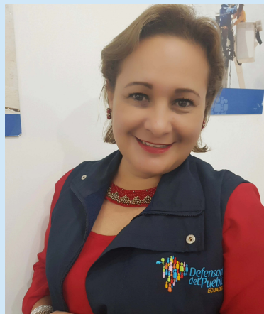
Delegada Provincial de Santa Elena