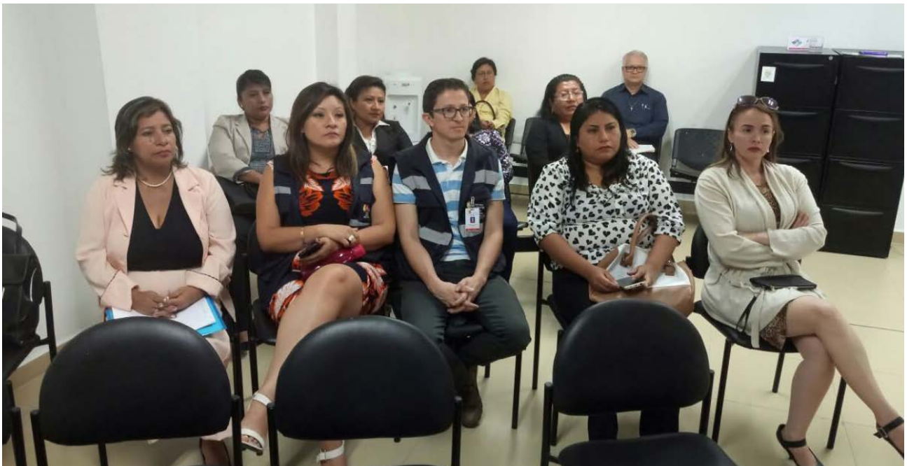
Retransmisión de evento sobre derechos sexuales y reproductivos ante autoridades de diferentes instituciones de Santa Elena.

Nota: Información tomada del sistema Gobierno por Resultados 2017 de la Defensoría del Pueblo de Ecuador.