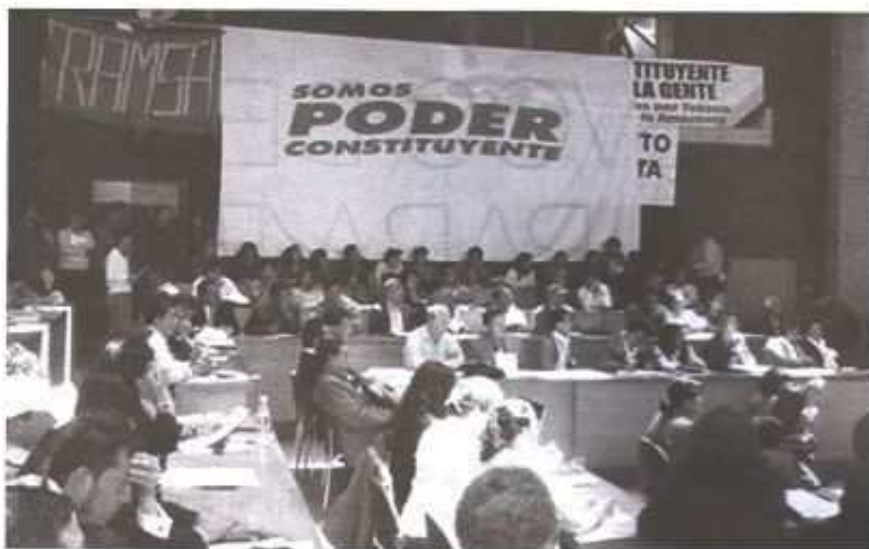
Asamblea "Somos Poder Constituyente".

El reto ahora es enriquecer nuestras propuestas en el debate, generar alianzas con organizaciones sociales de los sectores urbanos y rurales; ejercer el Derecho a la participación, vigilancia y movili-