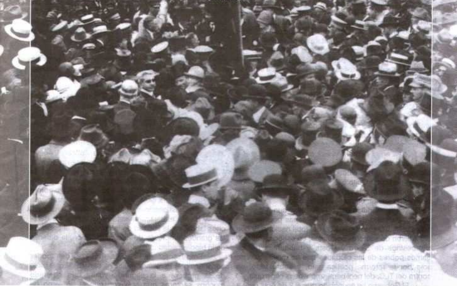
Concentración para la primera Asamblea Constituyente de 1830.

La Asamblea Constituyente se ha abierto definitivamente paso.