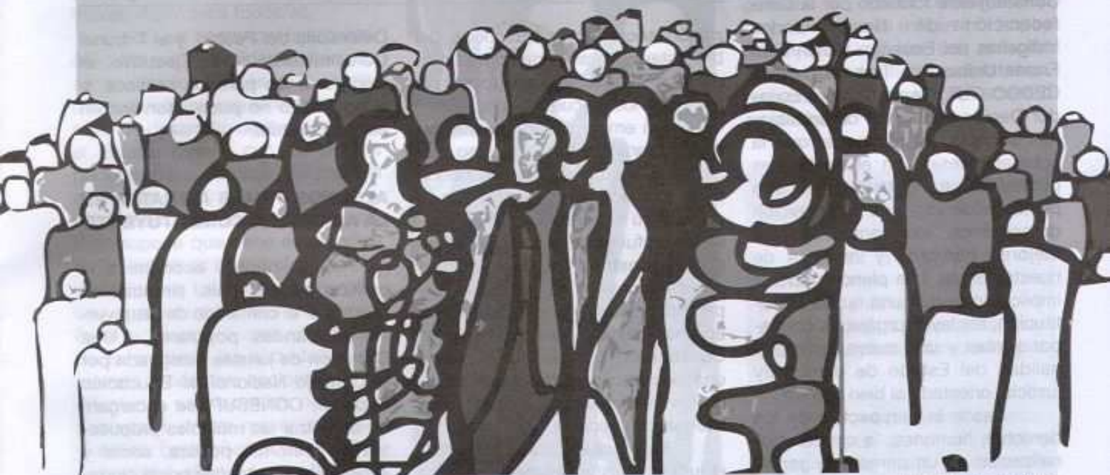
Ilustración: Sharián Sáenz

La intensidad y el grado de movilización popular que acarrea consigo el proceso político y social para instalar una Asamblea Constituyente con plenos poderes y adoptar una nueva Constitución Política del Ecuador, refleja el acumulado histórico de voluntad de cambio de amplios sectores sociales y su empeño por remover estructuras que sostienen la exclusión, la discriminación, el racismo, la desigualdad, la impunidad, entre otros factores que distorsionan el sistema democrático y el estado de derecho. Más todavía, distorsionan el carácter y ejercicio ciudadano de las personas.