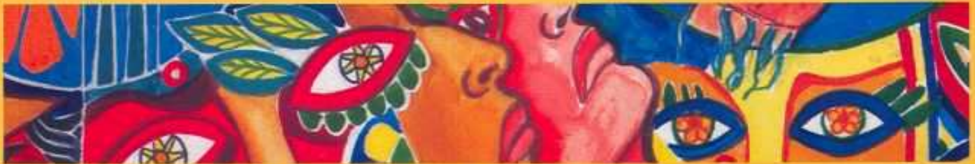
Ilustración: Gonzalo Mendoza. Detalle "Mural Sede Sindicato Trabajadores EEQ"

"Con el ideal de que los pueblos de Colombia tendrán finalmente la paz con justicia social que merecen".