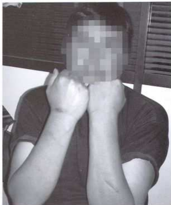
Penas por lo vivido y marcas que dejó la Tortura.