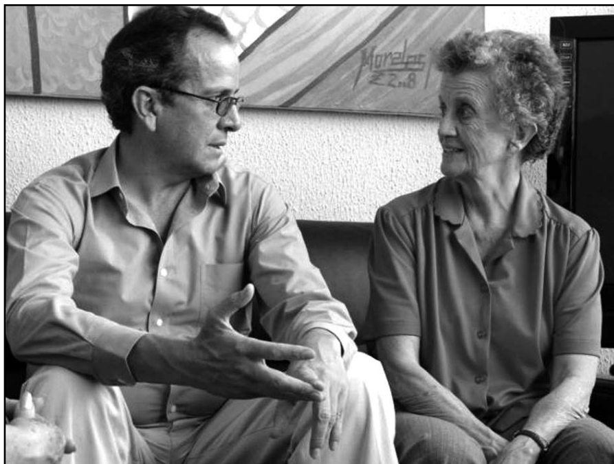
Asamblea Nacional Constituyente, Montecristi, 2008.