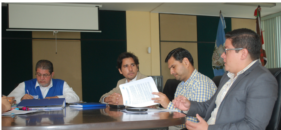
Coordinador General Defensorial Zonal N.4 en reunión de trabajo para garantizar calidad en la prestación de servicios públicos domiciliarios .