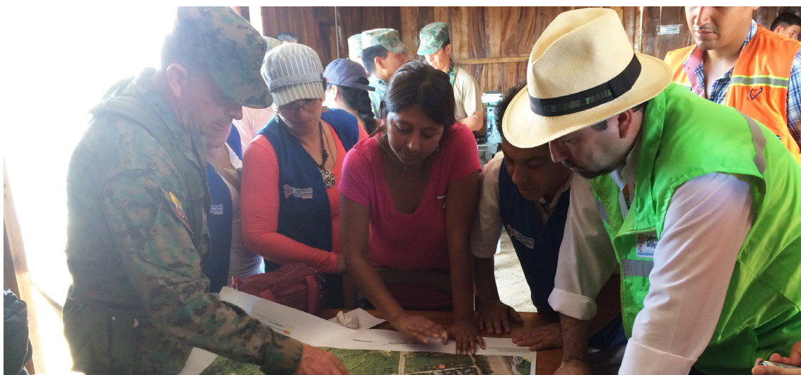
Defensor del Pueblo realiza visita in situ para verificar las condiciones de varias familias afectadas por el terremoto.

La Defensoría del Pueblo atendió el caso de una familia del cantón Pedernales que requería atención prioritaria, al encontrarse cinco de sus integrantes con discapacidad visual. Motivo por el cual la Defensoría articuló el trabajo con entidades como el Ministerio de Salud Pública que envió personal médico para evaluar las condiciones de salud de las personas y el Ministerio de Desarrollo Urbano y Vivienda que brindó asistencia para que la familia pueda ser beneficiada con el bono de recuperación habitacional, ya que a consecuencia del terremoto su vivienda había sido afectada.