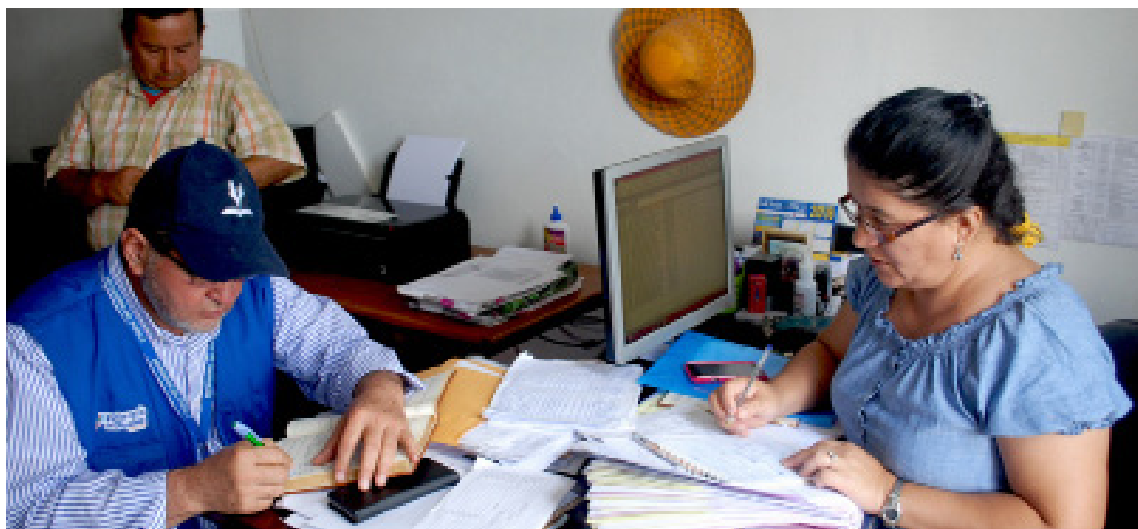
Reunión con la Jefa Política del cantón Flavio Alfaro para tratar sobre el ejercicio del derecho a la vivienda de personas afectadas por el terremoto.

Como resultado de una investigación defensorial se consiguió que el Alcalde del cantón Puerto López dispusiera dejar sin efecto las notificaciones de cobro por concepto de predios urbanos a las personas sin título de propiedad y que pertenecen a la Comuna Salango, beneficiando así a un total de 3 000 personas.