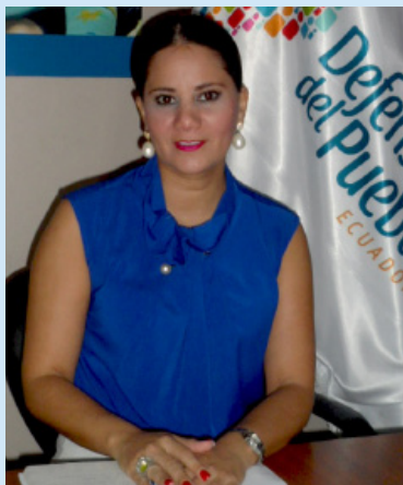
Coordinadora General Defensorial Zonal N°4