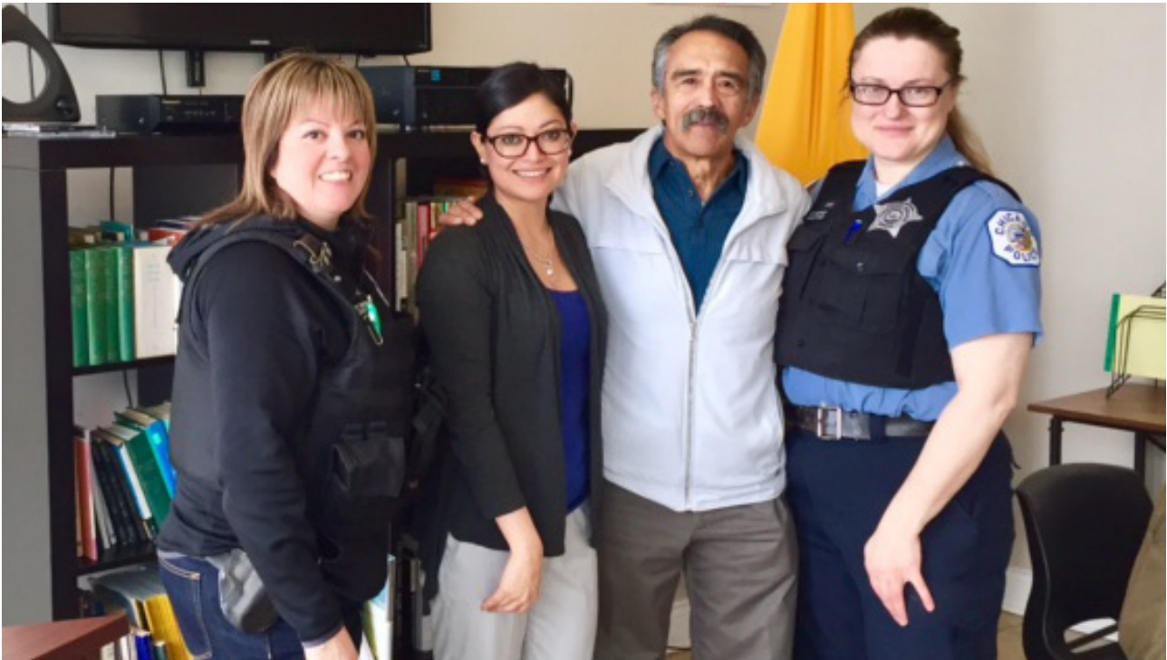
Delegada junto con oficiales de la Policía del Distrito 17, emprendiendo iniciativa contra el acoso y violencia en el espacio público a través de las clases de defensa personal para mujeres y niñas, con el apoyo de la Asociación "Ecuador Unido".