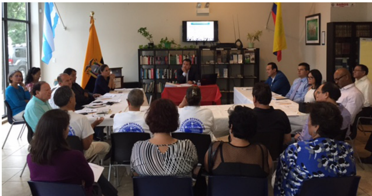
Participación de la Defensoría del Pueblo en las mesas de diálogo con organizaciones de la comunidad en Chicago.