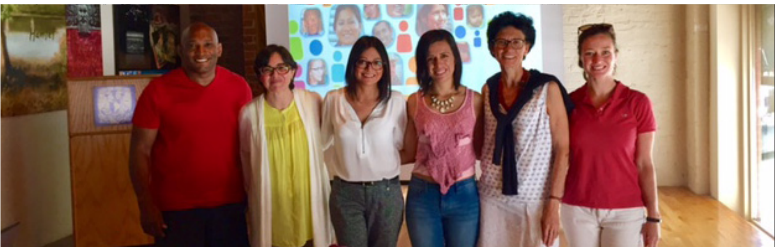
Delegación en Chicago impartiendo clases en derechos humanos a alumnos de la UNAM, campus Chicago.