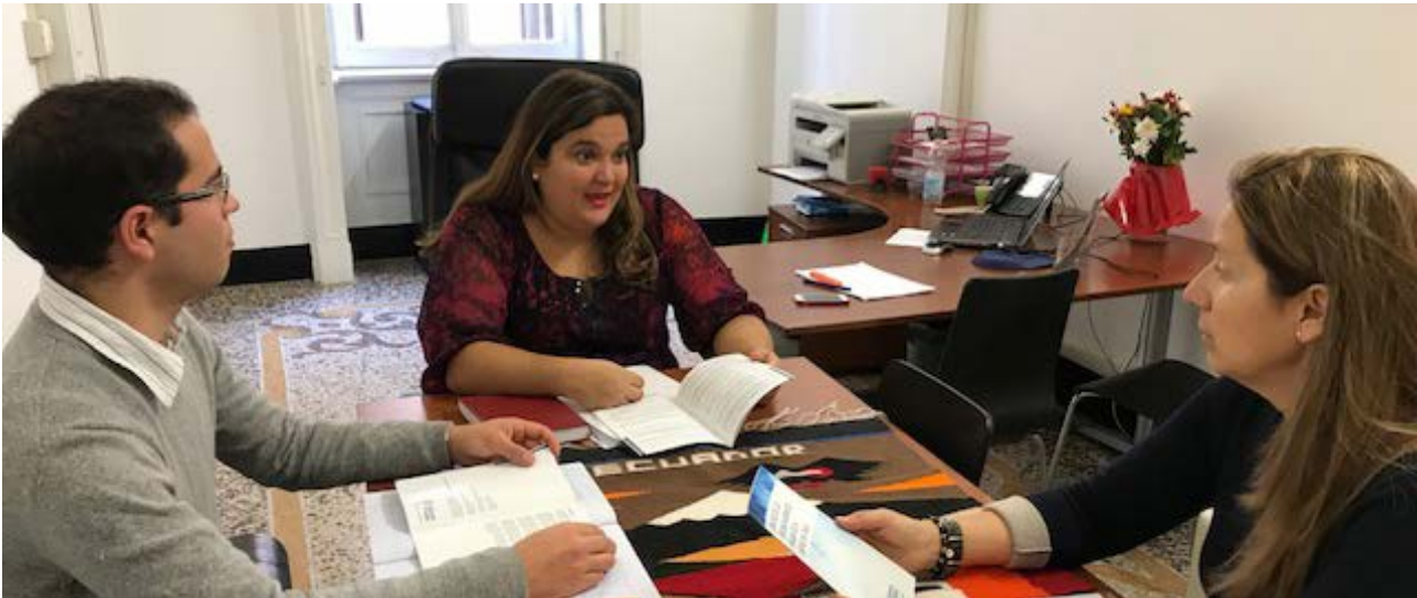
Reunión de trabajo entre la Delegación en Italia y los funcionarios que atienden los temas de movilidad humana en el Consulado en Milán.

Se realizó la observación electoral durante la jornada de elecciones presidenciales el día 1 de febrero de 2017 en Roma. Las observaciones realizadas fueron consideradas por la oficina consular, con el fin de mejorar e implementar medidas que garanticen el desempeño y el derecho al voto de las personas en situación de movilidad humana.