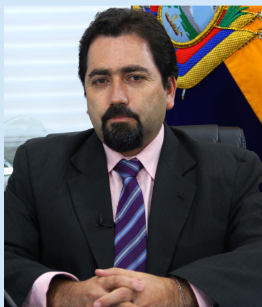
Defensor del Pueblo de Ecuador