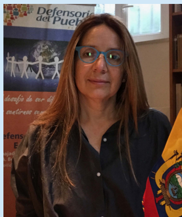
Delegada en el Exterior Italia - Roma