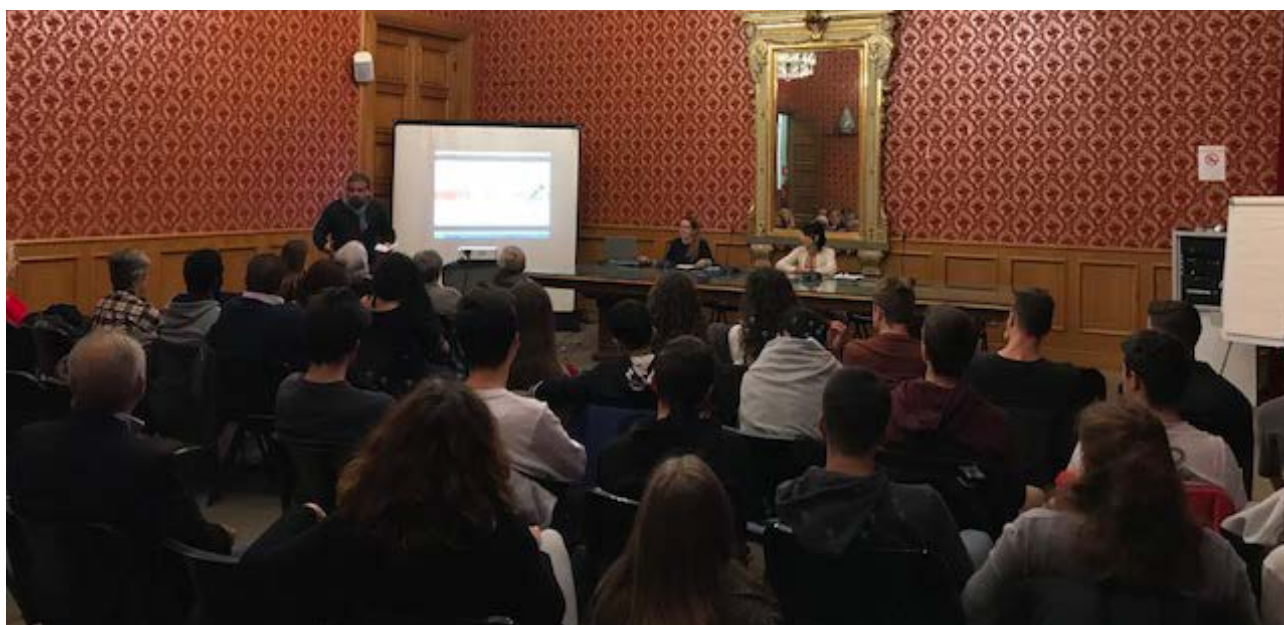
Participación en un proceso educativo sobre violencia de género y derechos humanos, organizado por la Asociación USEI en Savona, Región Liguria.

Nota: Defensoría del Pueblo de Ecuador, Gobierno por Resultados, 2017.