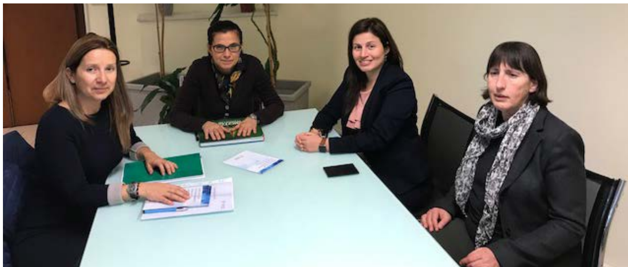
Reunión entre la Delegación en Italia y la Directora del Centro de Privación de Libertad de Pontedecimo en Génova, donde participaron educadoras de programas sociales.

La Delegación de la Defensoría del Pueblo en Italia y el Consulado de Ecuador en Génova mantuvieron un encuentro con la Directora del centro de privación de libertad de Pontedecimo ( Casa Circondariale Pontedecimo Genova ), el único centro de privación de libertad femenino de la Región Liguria, el mismo que hospeda también población masculina. Participaron en la reunión las educadoras responsables de los programas sociales, coordinadoras de los laboratorios y de las iniciativas de reinserción social.