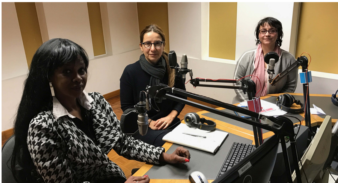
Trasmisiones de la Delegación de la Defensoría del Pueblo en Italia en Radio Vaticana, donde se reflexionó sobre la Declaración Universal de los Derechos Humanos y se informó sobre la aprobación de la Ley de Movilidad Humana del Ecuador.