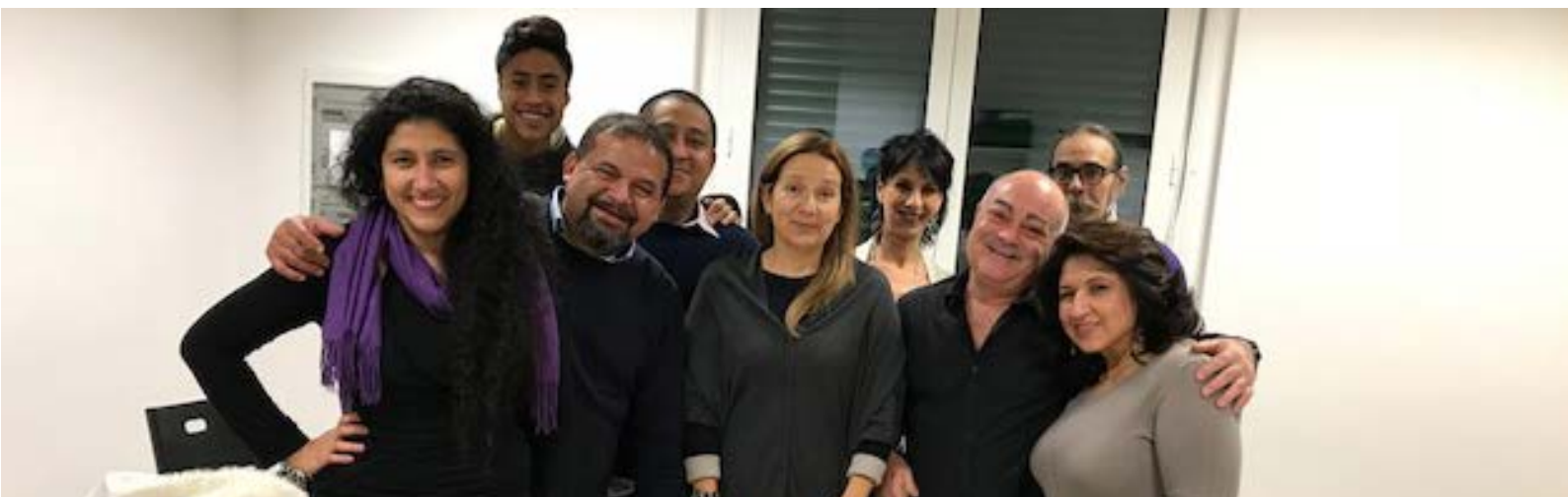
Visita de la Delegación en Italia a la sede de la Asociación Unión de Solidaridad de los Ecuatorianos en Savona, Región Liguria.